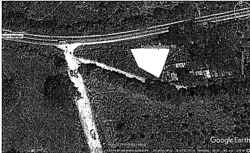
Imagen1. Se localiza el área donde están disponiendo inadecuadamente los residuos sólidos ordinarios del municipio de Luruaco. Área de aproximadamente de 800 m 2 , con un perímetro de aproximado de 115 metros.

“POR MEDIO DE LA CUAL SE IMPONE UNA MEDIDA PREVENTIVA DE SUSPENSIÓN DE ACTIVIDADES Y SE INICIA UN PROCEDIMIENTO SANCIONATORIO AMBIENTAL CONTRA EL MUNICIPIO DE LURUACO-ATLÁNTICO, NIT. 890.103.003-4.